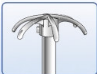
Particolare estremità stilo - Particular of the whip end